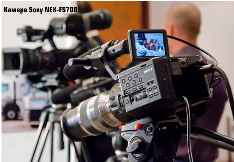
Камера Sony NEX-FS700

В этом году в Алма-Ату мы привезли достаточно много оборудования, в том числе две новинки и ряд наших доступных бюджетных решений. В основном это модели линейки NXCAM. Хочется отметить, что посетителям выставки представляется случай одними из первых увидеть в СНГ наш новый камкордер NEX-FS700 с возможностью высокоскоростной съемки до 960 к/с. В настоящее время это самая доступная камера такого типа. Презентации еще не было даже в Москве и мы успели её показать пока только на киевской "Телерадиоярмарке". Организация мероприятия, начиная с первых шагов у столов регистрации, выполнена идеально. Уже сейчас мы можем сказать с уверенностью, что, если выставка будет в следующем году проводиться, мы будем в числе ее участников и попробуем расширить свое присутствие. Это касается как оформления стенда, так и более развернутой программы наших презентаций, посвященных профессиональному оборудованию Sony.