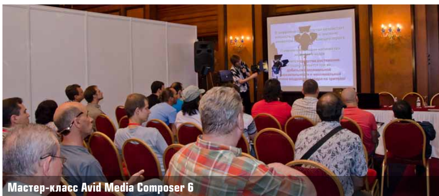
Мастер-класс Avid Media Composer 6