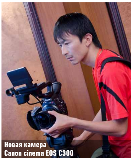
Новая камера Canon cinema EOS C300