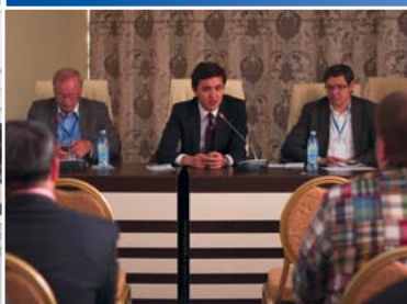
Деловой клуб_Спорт и ТВ